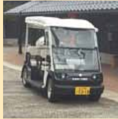
エコな電動カート

多くの市町村が抱える問題として高齢化率の上昇、人口減少、人口流出による公共交通機能の低下などがあります。自治体の厳しい財政状況により、電車やバスが減便、廃線になるなど負のスパイラルがおこっています。そんな中、新たな次世代交通システムとして電動カートを活用した交通対策事業に取り組んでいました。