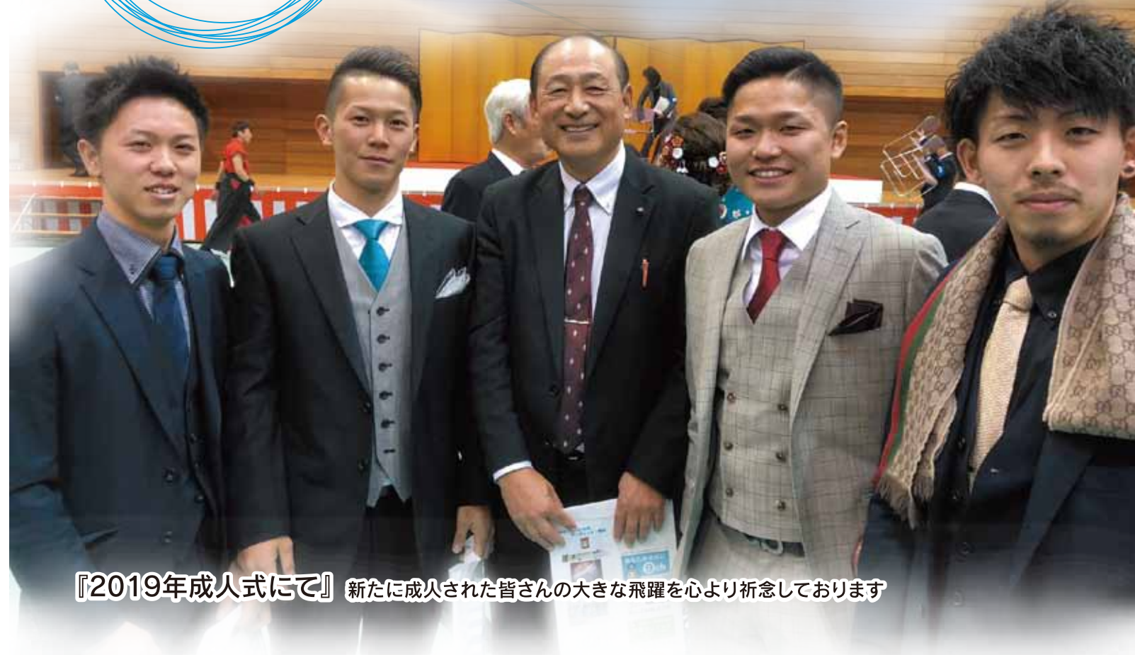
『2019年成人式にて』新たに成人された皆さんの大きな飛躍を心より祈念しております